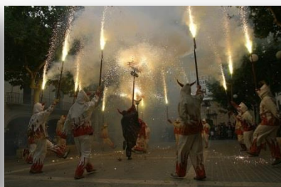
Eldshow "Performance Dimonis"