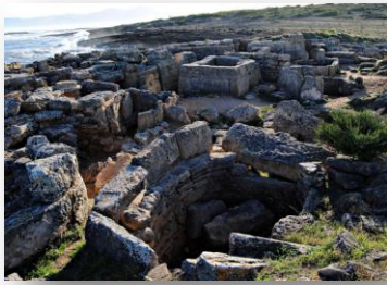
Naturreservatet Son Real