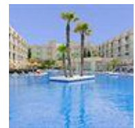
Det trevliga 4-stjärniga hotellet Eix Alzinar Mar...