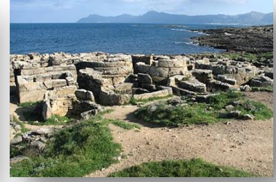
Naturreservatet Son Real