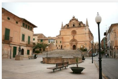
Stadsrundtur Santa Margalida

Under eftermiddagen, paus med servering av kaffe, te, juice med tilltugg samt en minimässa där lokala utställare visar traditionella mallorcanska produkter.