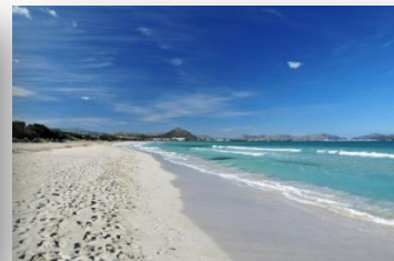
Capellan – Platja de Muro